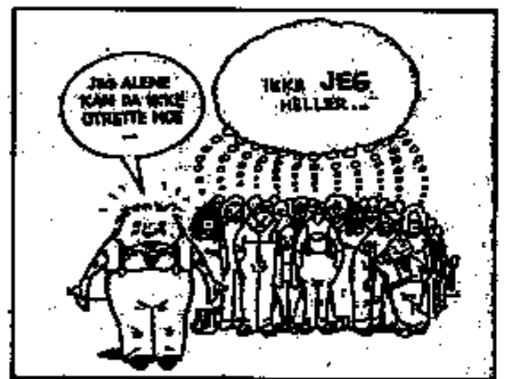
Hver og en av oss kan gi sitt bidrag til å stanse den økonomiske veksten.

Bergstrøm er opptatt av hva det betyr for barn og unge at vi lever i et gjennomorganisert samfunn. Vårt nåværende samfunn omtaler han som et informasjons- eller