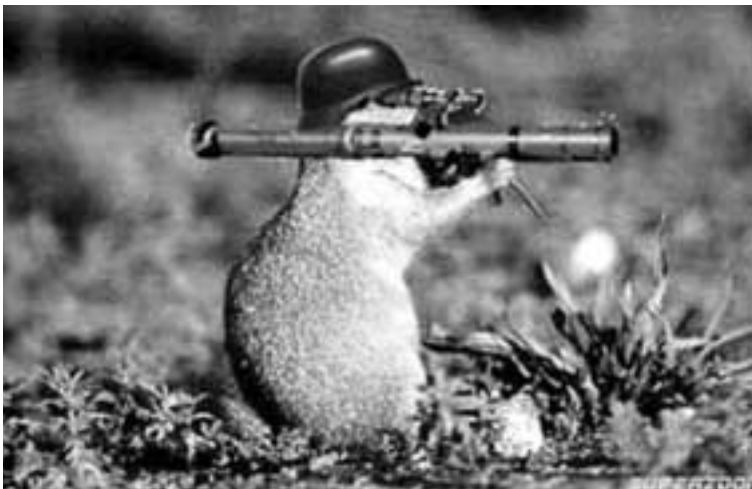
USA har trent opp nye soldater i ørkenkrigen i Irak....