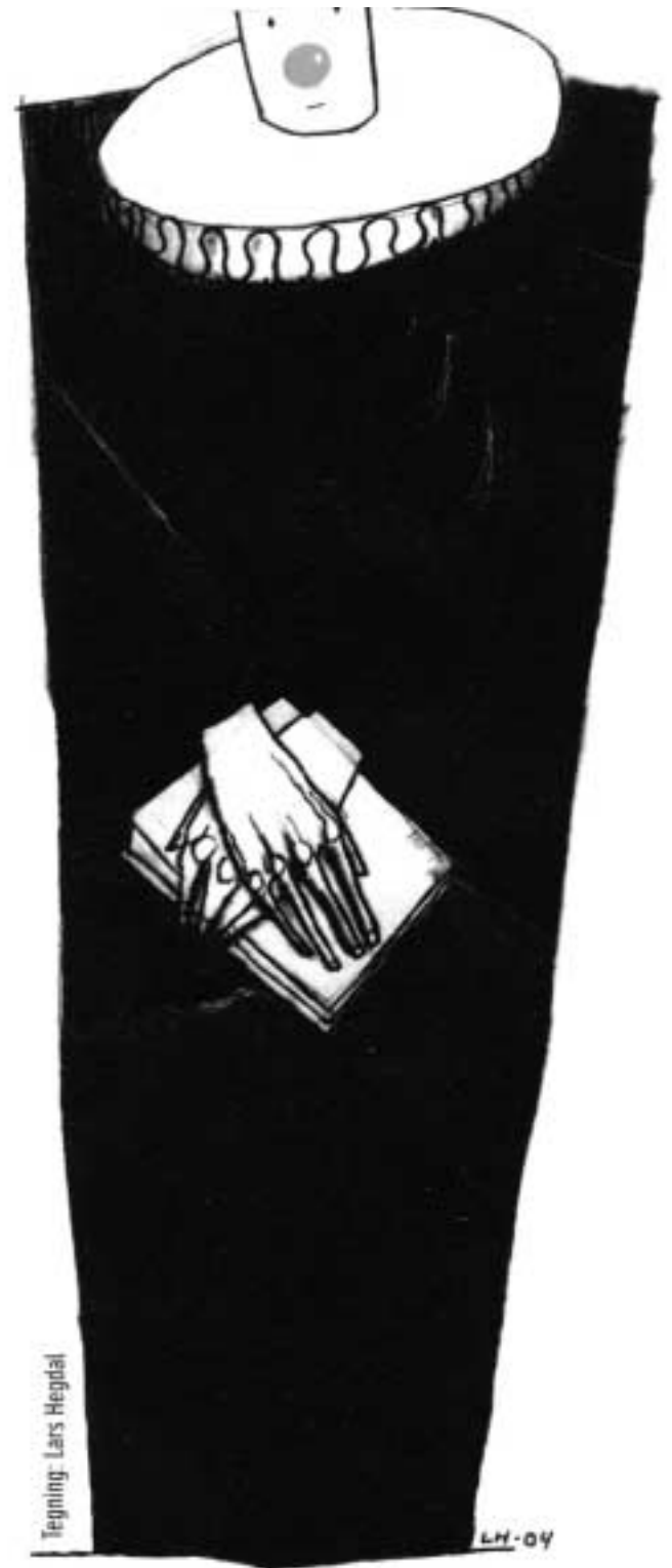
På rett hylle? Enkelte av oss valde kan hende ikke det yrket som høver best til personlegdomen vår.

Den andre fristelsen «Den midtpunktsøkende drift», med den symbolske tempeltiden, forteller enkelt at du skal ikke blåse deg opp eller bli høy på pæra og tro og ønske å være midtpunkt og tro at du er noe – for alt