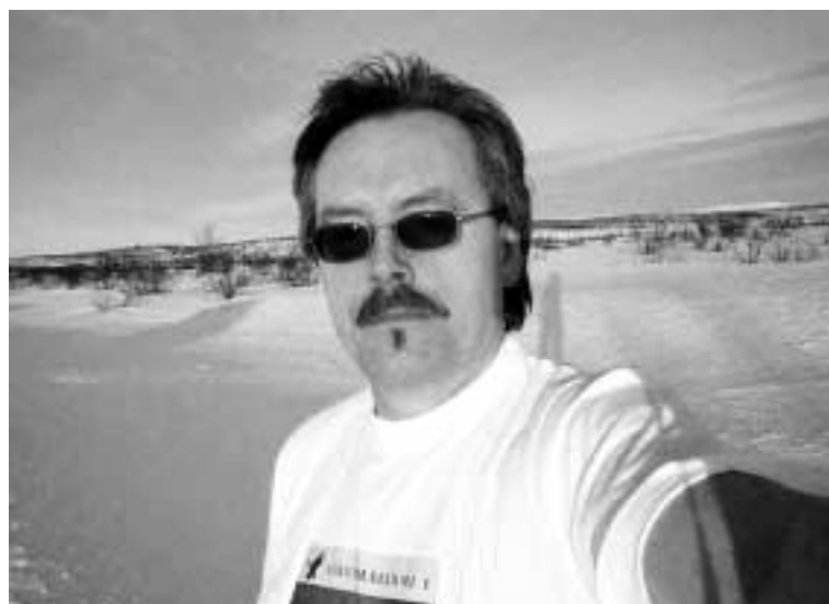
Forfatteren i frosset posisjon midt på vidda i -18 C og lav sol.