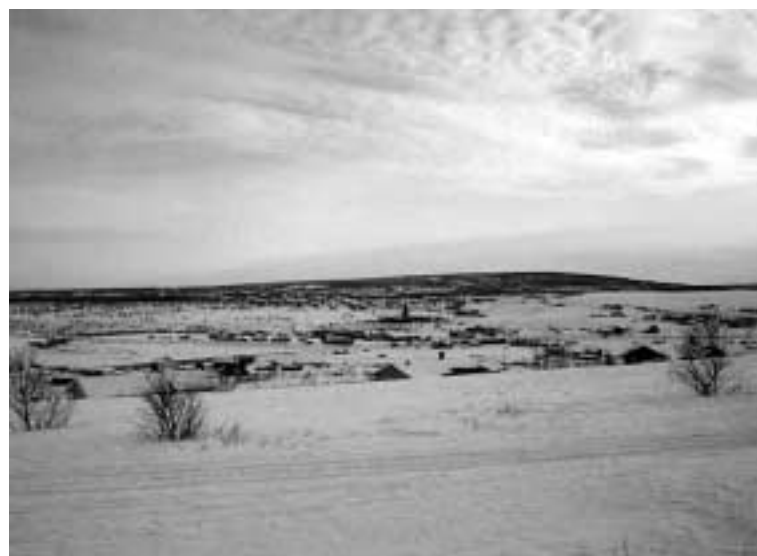
Kautokeino med kirken i bakgrunnen.