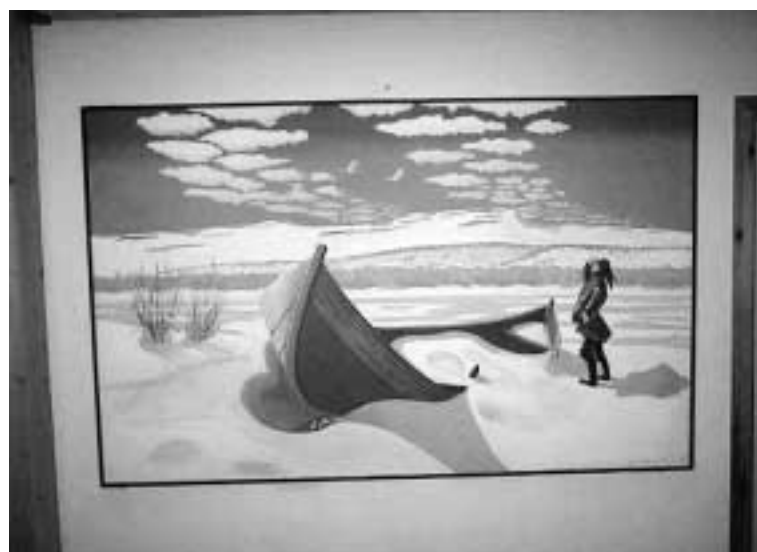
I lokalene til Assu og Duodje-verkstedet fant jeg dette bildet.