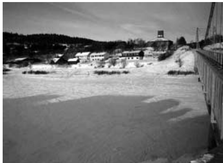
Godt med snøscooterspor på Karasjokka.