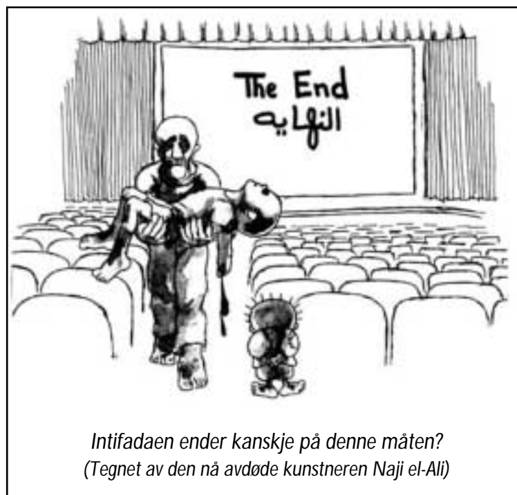
Intifadaen ender kanskje på denne måten? (Tegnet av den nå avdøde kunstneren Naji el-Ali)