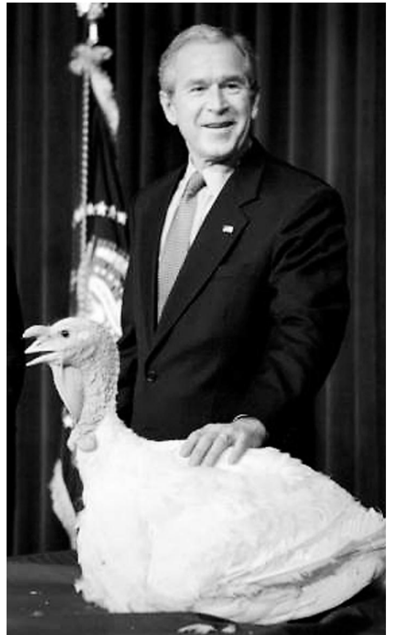
Bush reddet denne kalkunen fra å bli middag på høsttakkefesten. Som guvernør i Texas benådet han aldri en dødsdømt fange...

Øverlands innstendige bønn i diktet «Du må ikke sove» fra 1939 gjelder fremdeles og kanskje særlig for oss krigsprofiterer. Vi må få våre historiske krigsprofiterer frem fra glemselens lys for å reflektere over det moralske ansvaret hver enkelt av oss og fellesskapet har i alle situasjoner. Historiegransking handler ikke om å dømme de andre for så å frikjenne seg selv. Vi kan ikke fortsette til oljen tar slutt med å tjene så inderlig vel på den urett som ikke rammer oss selv.