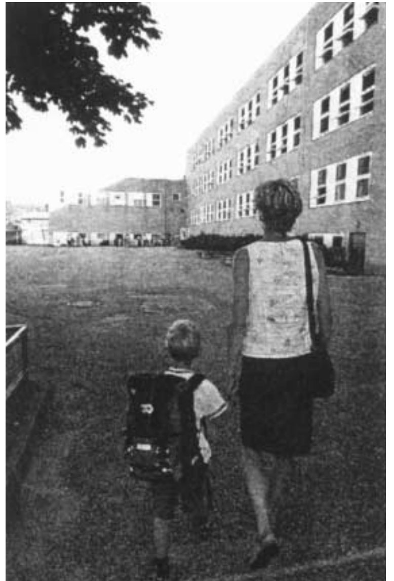
PRESS: Hvis det ikke legges press på lese- og skriveferdigheter de tre første skoleårene, kunne barnet kanskje bevare sine røde kinn helt til det fikk en sunn, naturlig kunnskapstørst, mener artikkelforfatteren.

Utopia? Ja, men vi trenger virkelig en «krig» mot vår hjemlige Taliban for å fri barna ut fra sin burhøns-tilværelse. Men de som har makt og innflytelse, har selv blitt så hjerne-